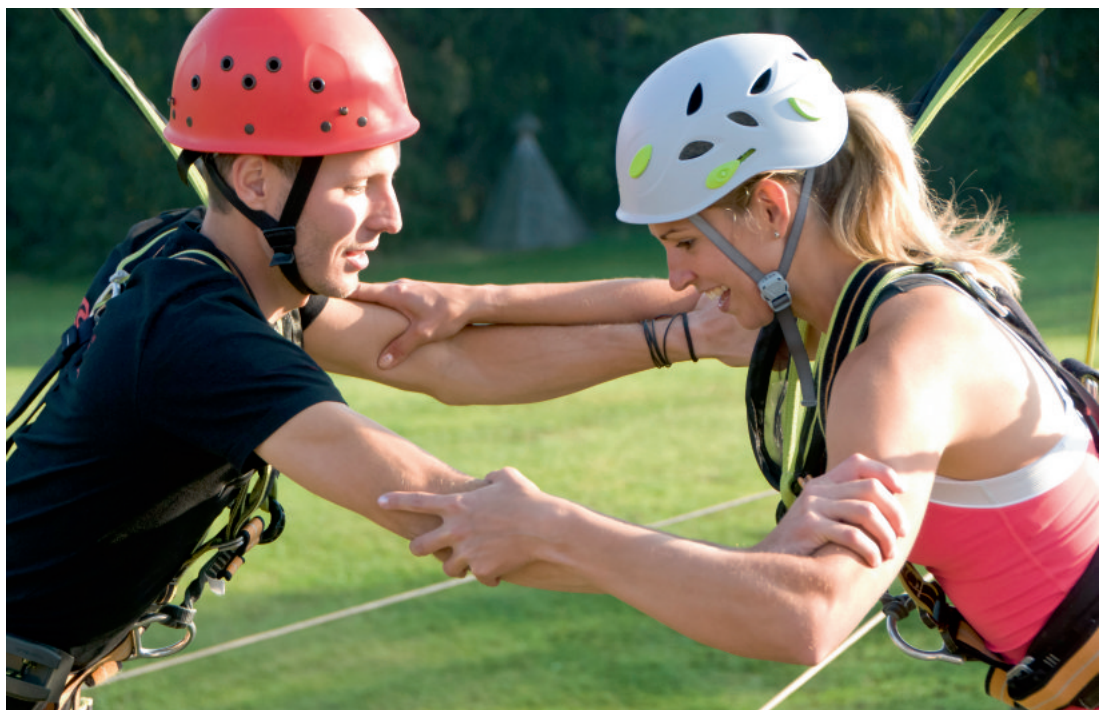
Das Klettern mit Kollegen kann vertrauensbildend wirken.